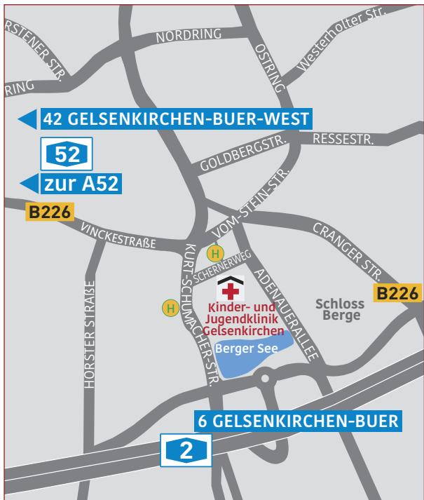
Stand: Juni 2022.