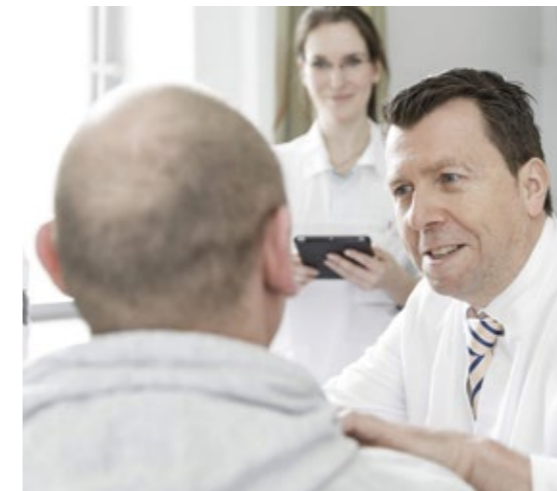
KONTROLLUNTERSUCHUNG NACH EINER SCHILDDRÜSEN OPERATION

7) Der Patient erhält bei Entlassung eine Beratung und einen Entlassungsbrief mit individuellen Verhaltensempfehlungen, der Histologie des Schilddrüsen-Präparats und ggf. Anpassung der Schilddrüsenmedikation.